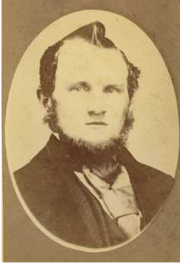
Tab edilmiş baskı örneği (P.O.P. – printed-out-print)

haricindeki metaller (demir ve platin) ile pigmentler (boya maddeleri)'dir. Bu grupta yer alan fotoğraflara koleksiyonlarda rastlanılmakla birlikte sayıları azdır.