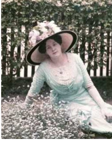
Bir Otokromun detayı

renkli fotoğraflar, rengini boyanmış nişasta tozundan alan ve cam plaka üzerinde oluşturulan Otokromlardır. Bu teknik 1'inci Dünya Savaşı'nın hemen öncesinde kullanıma girmiş olsa da renkli kâğıt ve film malzemeleri 1930'lar ve 1940'lara kadar yaygınlık kazanmamıştır.